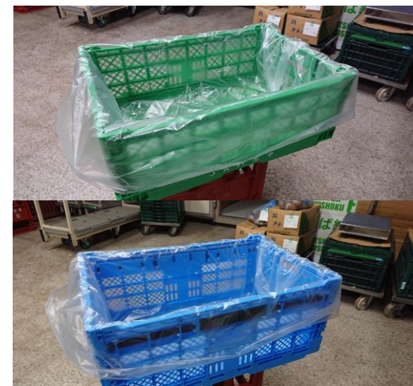
コンテナ全体にビニールシートを広げて風が当たらないようにしてください。(図2)