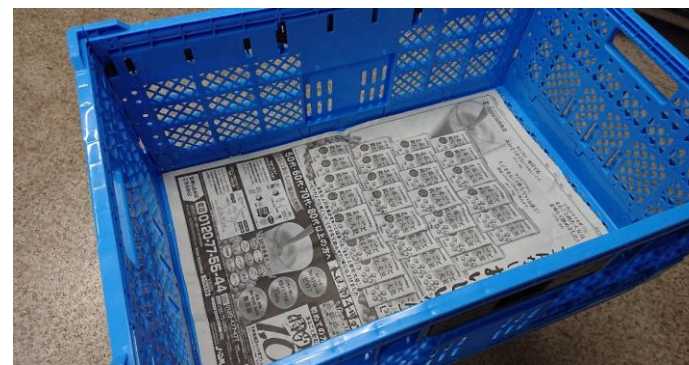
新聞紙を折りたたむか半分に切って下に敷いてください。(図3)